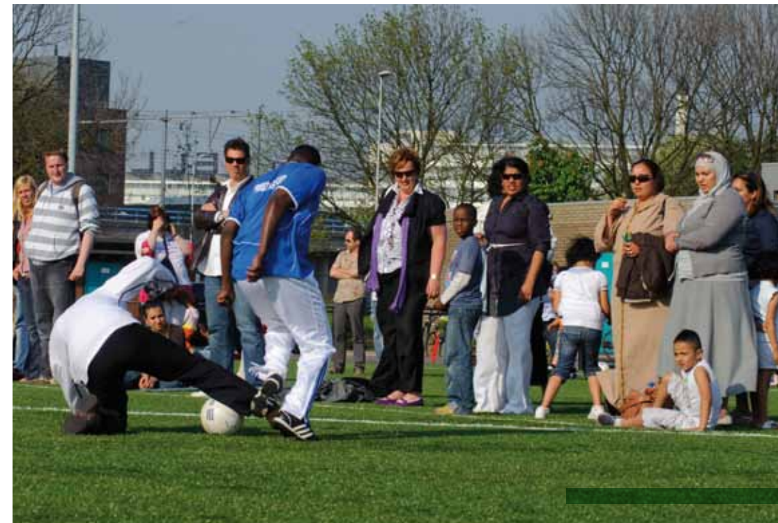
Fotograaf: Jan van der Ploeg

Dat laatste bevestigt trouwens een algemene indruk: bij alle aandacht voor Nieuw-West is de situatie in Zuid-Oost zorgelijk te noemen. Natuurlijk wonen er in dat stadsdeel ook veel andere groepen, maar met een deel van de Surinaamse gemeenschap gaat het minder goed dan vaak wordt aangenomen. Dat beeld wordt bevestigd door de